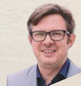
Dr. Martin Rosemann

MdB, Obmann Ausschuss für Arbeit und Soziales, SPD (angefragt)