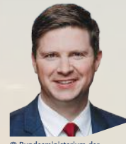
Dr. Florian Toncar