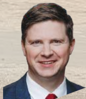
Dr. Florian Toncar

MdB, (ehem. Staatssekretär, Bundesministerium für Arbeit u. Soziales)