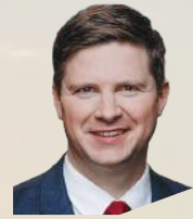
Dr. Florian Toncar