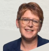
Dr. Tanja Machalet

MdB, rentenpol. Sprecherin, SPD (angefragt)