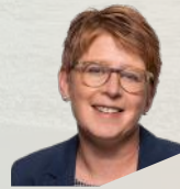
Dr. Tanja Machalet

MdB, rentenpol. Sprecherin, SPD (angefragt)