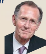
Prof. Dr. Dr. h.c. Bert Rürup

ehem. Moderator ZAV; Präsident Handelsblatt Research Institute