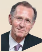
Prof. Dr. Dr. h.c. Bert Rürup

ehem. Vors. d. Sachverständigenra- tes d. Bundesregierung; Präsident Handelsblatt Research Institute